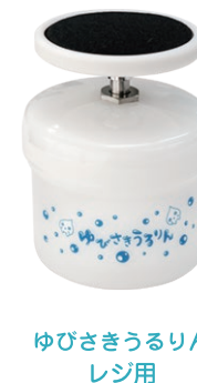
ゆびさきうるりん レジ用

ゆびさきうるりんレジ用は特定少数の方が使用することを想定した商品です。サッカー台など不特定多数の方が使用される場所では、お勧めしておりません。（水にて使用する商品です。）