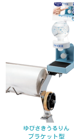
ゆびさきうるりん ブラケット型

ゆびさきうるりんレジ用は特定少数の方が使用することを想定した商品です。サッカー台など不特定多数の方が使用される場所では、お勧めしておりません。（水にて使用する商品です。）